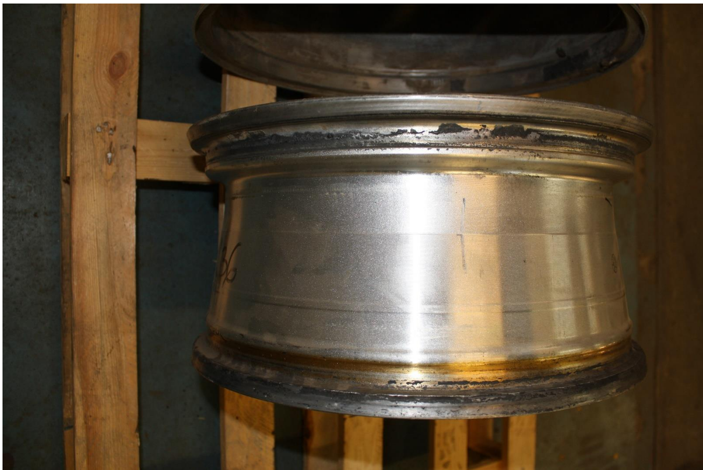
3. Przykładowe zdjęcia - aluminiowe felgi samochodowe do pojazdów m. Jeep Wrangler, 18 cali – 7 szt.;