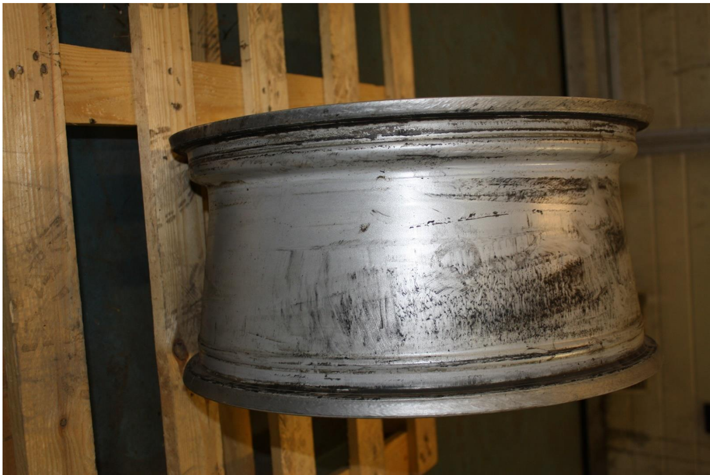
2. Przykładowe zdjęcia - aluminiowe felgi samochodowe do pojazdów m. Mitsubishi Pajero, 17 cali, ET 46 - 85 szt. i aluminiowe felgi samochodowe do pojazdów m. Mitsubishi Pajero, 17 cali, ET 38 - 16 szt.;