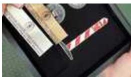
Zdjęcie poglądowe (znak graniczny)